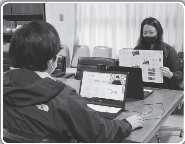
オンライン移住相談の様子