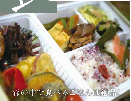
森の中で食べるごはんは絶品!