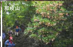
なまきさん 那岐山