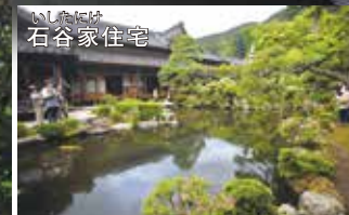
いしあけ 石谷家住宅