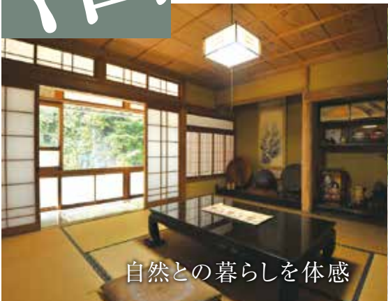
自然との暮らしを体感