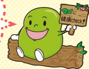
智頭町健診キャラクター まめ助くん

特定・後期高齢者健診は 「健康ポイント」の対象です! 健康になって、 健康ポイントも貯まる。 良いこといっぱい!