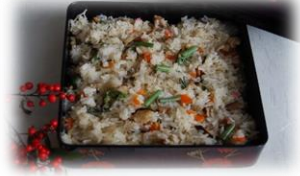
～大山ブロッコリー～