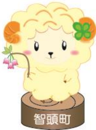
睡眠キャンペーン キャラクター「スーミン」

自死 *1 の要因には、精神保健上の問題だけでなく、過労、生活困窮、育児や介護疲れ、いじめや孤立などの様々な要因があり、追い詰められた末の死が自死とされています。