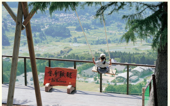
▲牧場公園グレンデ山頂にある大型のブランコ