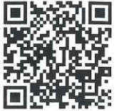
ふるさと納税 WebサイトQRコード