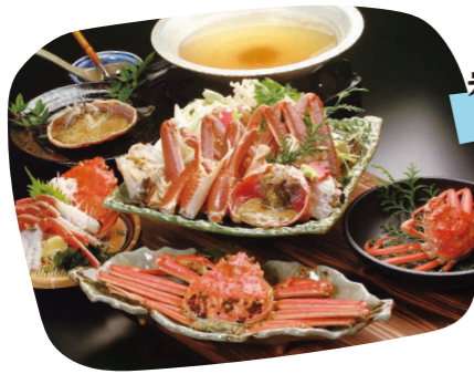
岩美町のオススメ