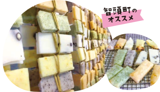
智頭町のオススメ

岩美町役場 商工観光課 〒鳥取県岩美郡岩美町浦富675-1 ☎0857-73-1416