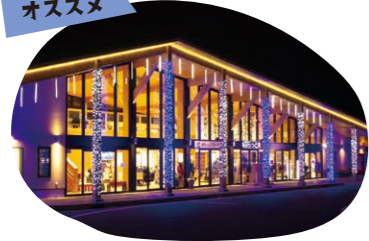
八頭町の冬を彩るイルミネーション 八頭町のオススメ

郡家駅及びぶらっとびあ・やすでクリスマス前後に実施されるイルミネーション。12月から1月上旬まで楽しめます。