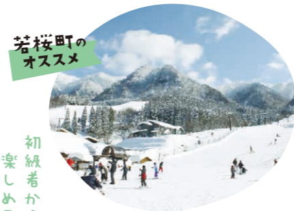
若桜町のオススメ