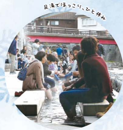
足湯でほっこり、ひと休み

平安時代の開湯と伝わる湯村温泉は、肌にやさしい弱アルカリ泉。源泉は98℃、荒湯で茹でる温泉玉子は格別です。映画「夢千代日記」のロケ地になった温泉街散策もぜひ。