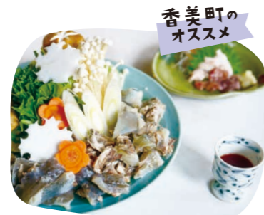
香美町のオススメ

ぶらっとびあ・やす(八頭町観光協会) 〒鳥取県八頭郡八頭町郡家648-6 ☎0858-72-6007