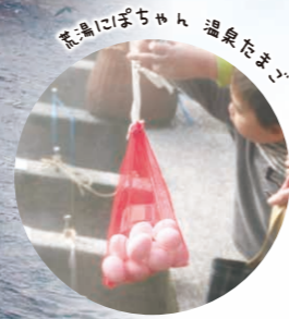
温泉にたまご 温泉たまご