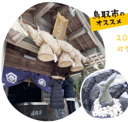
鳥取市のオススメ