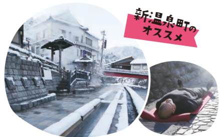
新温泉町のオススメ

わかさ氷ノ山スキー場 〒鳥取県八頭郡若桜町 つく米631-13 ☎0858-82-0512