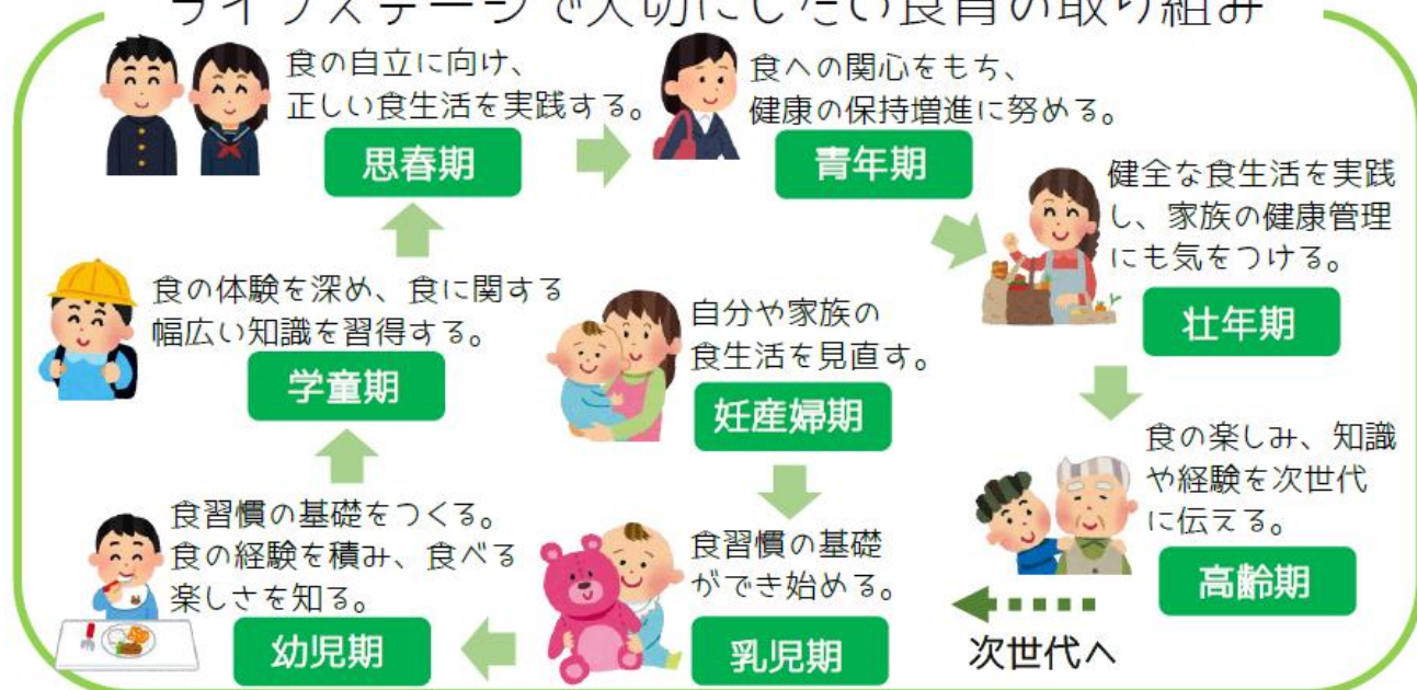
【図10 ライフステージにおける食育の取り組み】