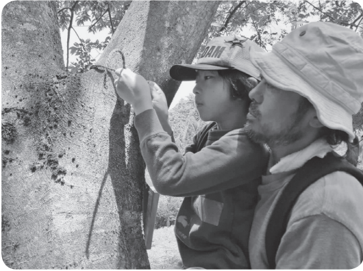
樹名板を取り付ける参加者

森林セラピーロード天木森林公園コースで樹木観察会が開催され、土師地区振興協議会役員を含め40人が参加しました。