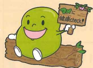
智頭町健診キャラクター まめ助くん

特定・後期高齢者健診は「健康ポイント」の対象です! 健康になって、健康ポイントも貯まる。良いこといっぱい!