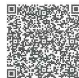
集団健診QRコード (とっとり電子申請サービス)