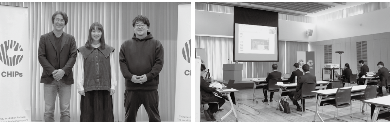
▲現地登壇参加者(大阪・京都・東京より参加) ▲会場内の様子 一般観覧の人も多数お越しいただきました

今秋、地域に新しい風を呼び込むビジネスプランコンテスト「CHIPs Audition 2025」が開催され、智頭町での事業づくりに意欲を持つ挑戦者たちが集まりました。