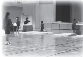
中学校体育・英語の様子