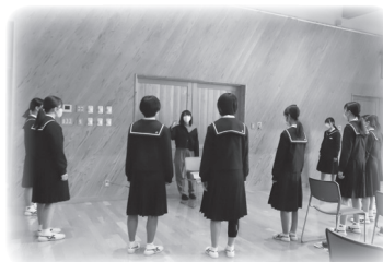
中学校合唱の様子

次回の学校運営協議会は、子どもたちと委員の皆さんで今後取り組んでいくテーマについて話し合う機会を設ける予定です。