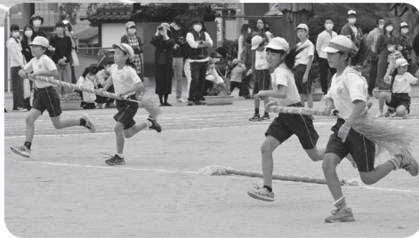
競技の様子（前半、後半より）