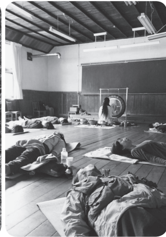
森林セラピー®(左)とサウンドヒーリング(右)の様子

森林セラピー®とサウンドヒーリングのコラボイベントが開催され、8人が参加しました。サウンドヒーリングは、様々な周波数の音を奏でて人を癒やすもので、森林セラピー®と組み合わせることにより、リラクゼーション効果が増加すると期待されています。参加者らは、森林セラピー®で森の中を歩きリラクゼーションした後、サウンドヒーリングを受けました。今回初めて体験した参加者は、「木や音から力を貰えて、とても贅沢な時間だった。身近な人を誘ってまた来たい」と満足そうに話していました。