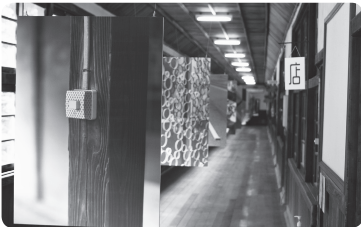
約80mの廊下には作品がずらり

世界の各国のアーティストによる、マスキングテープを使った作品の展示会「MT(マスキングテープ)アートプロジエクト」が旧山形小学校で開催されました。