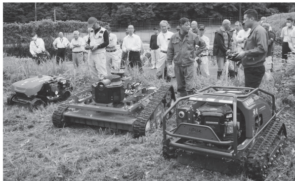
リモコン草刈り機実演会の様子