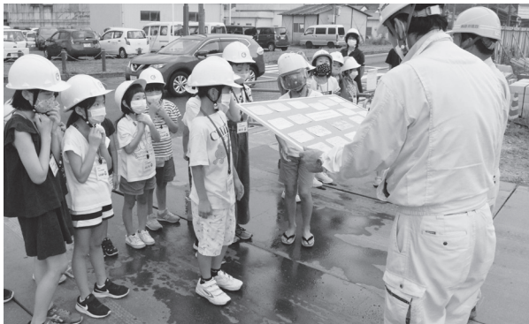
感謝のメッセージを渡す児童