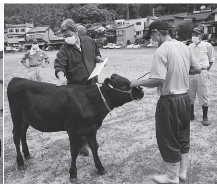
厳正な審査が行われています