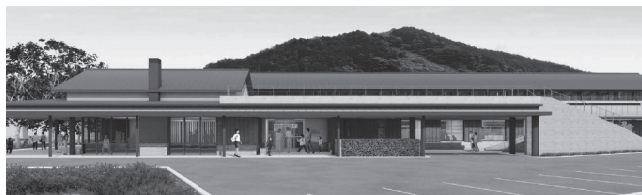
↑ 新しい図書館の外観 (正面入口の様子)