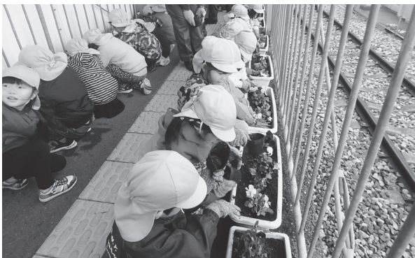
園児の花植えの様子

メインイベントでは、Montblancの協賛により、林業防護服を着た生徒によるファッションショーが行われ盛況に終わりました。