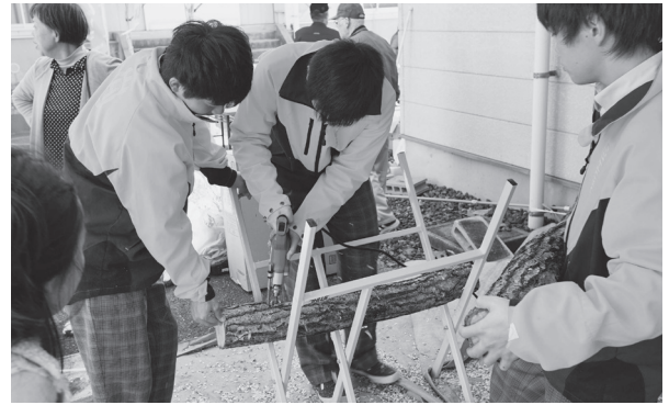
しいたけの菌打ち体験