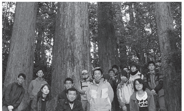
大木を背景に記念撮影!