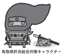
鳥取県肝炎総合対策キャラクター