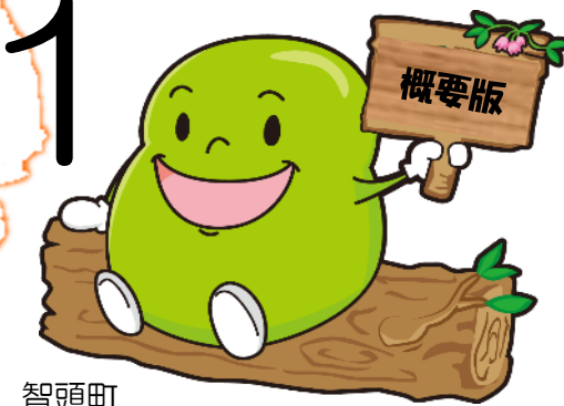
智頭町 健診キャラクター「まめ助くん」

我が国では、少子高齢化や疾病構造の変化により、国民の健康づくりを考える上で、また持続可能な社会保障制度を考える上でも生活習慣病予防が重要となっています。