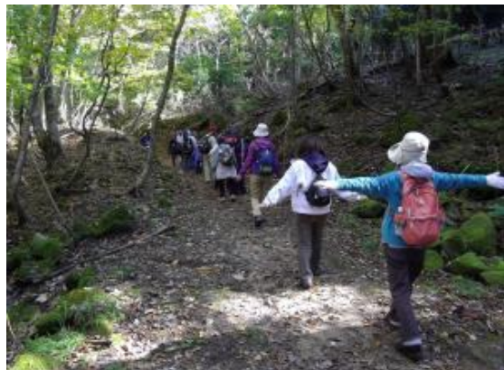
豊かな自然を活かしたセラピーロード